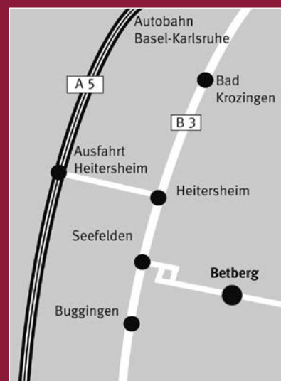
Redaktionsschluss Juli 2021. © Atelier Giebel, Fotos: Angelika Breier

Die nächste Bahnstation heißt Heitersheim. Meistens können wir Sie nicht selber abholen, dann bitten wir Sie, ein Taxi zu nehmen. Ein Taxi erreichen Sie unter Tel. 07634-3134 (ca. 18 EUR). Zu Fuß läuft man von Heitersheim nach Betberg etwa eine Stunde.